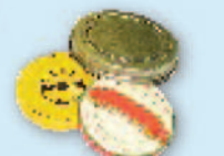
Loose metal jar lids & steel bottle caps Tapas de metal para frascos