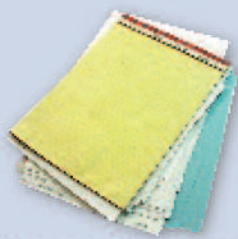
White or pastel office paper Papel de oficina color pastel o blanco