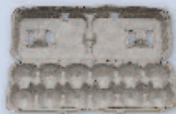
Paper egg cartons Envases de cartón para huevos