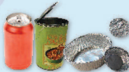
Cans (do not crush), clean, balled aluminum foil & pie pans Latas (no aplastarlas), papel de aluminio limpio en un globo