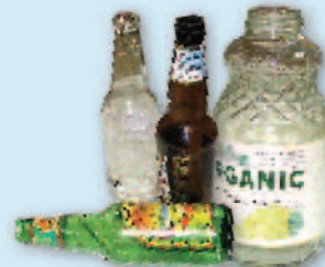
Glass bottles & jars Botellas y jarras de vidrio