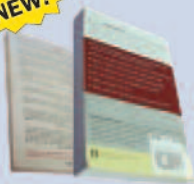
Paperback books libros de tapa blanda