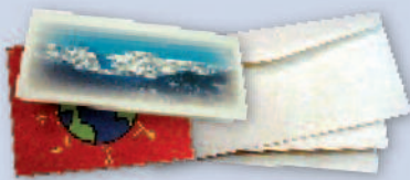
Opened mail & greeting cards Correo abierto y tarjetas de felicitación

You can now place all recyclables in one bin!