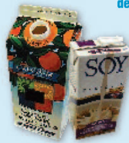
Milk cartons & drink boxes (no foil pouches) Cajas y envases de papel de leche y jugo (no bolsas hechas de aluminio)