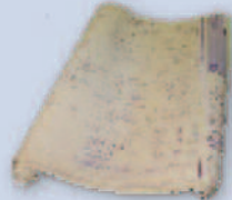
Blueprints Planos de proyecto