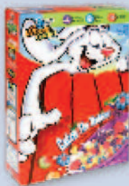
Paperboard boxes Cajas de papel cartón