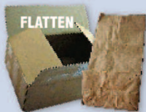
Corrugated cardboard & brown paper bags Cartón corrugado y bolsas de papel marrón