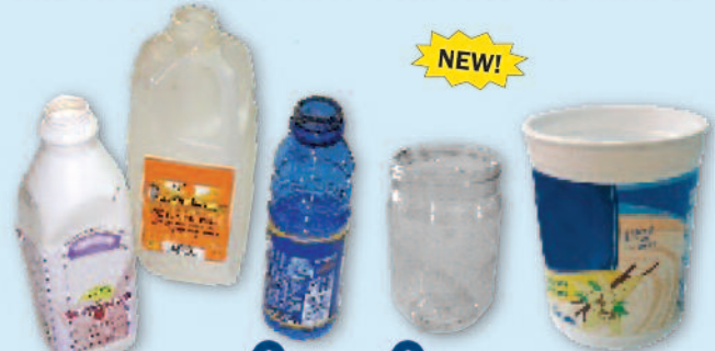
Plastic bottles, jugs, tubs & screw-top jars (no lids, no #7 PLA compostables) Botellas y envases de plástico (no tapas, no #7 PLA compostables)