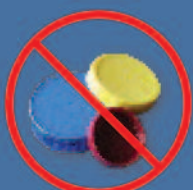
plastic caps or lids