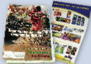
Magazines & brochures Revistas y folletos