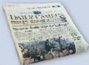
Newspapers & inserts Periódicos y propaganda insertada