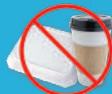
Styrofoam® or paper takeout containers or cups