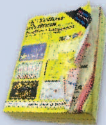
Phonebooks Guías de teléfono